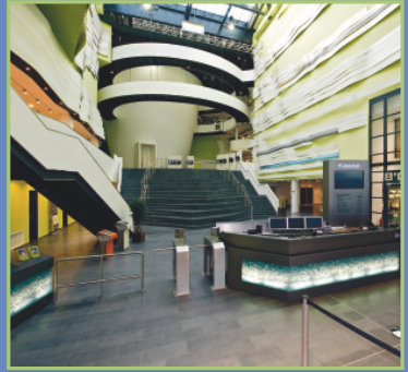
Das Foyer des Klimahaus® Bremerhaven 8° Ost