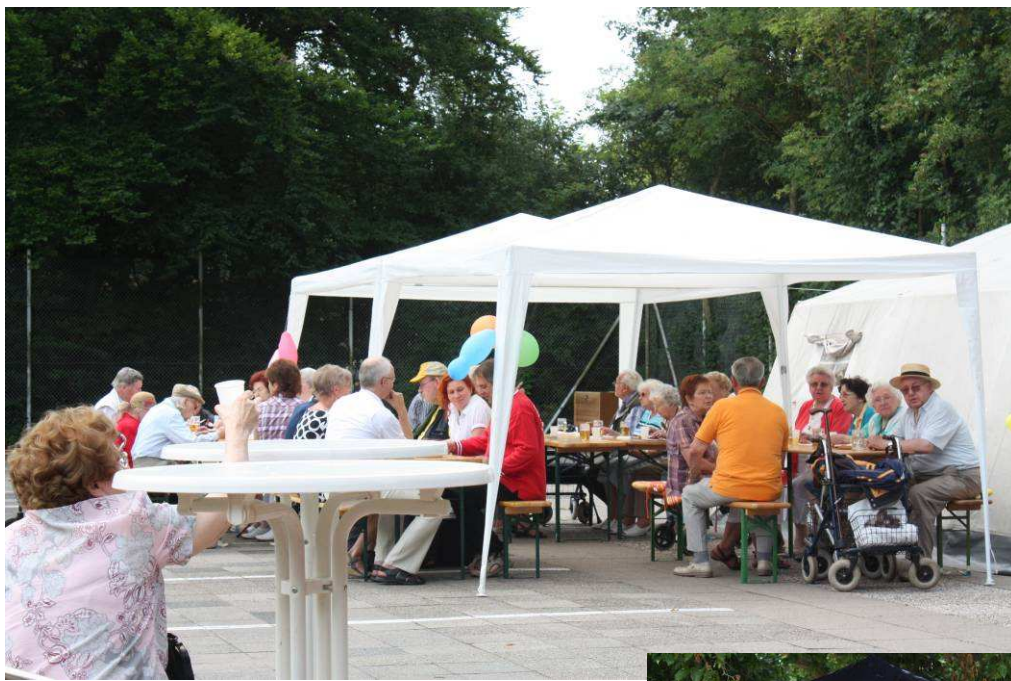
Nachbarschaftsfeste in der Sonne