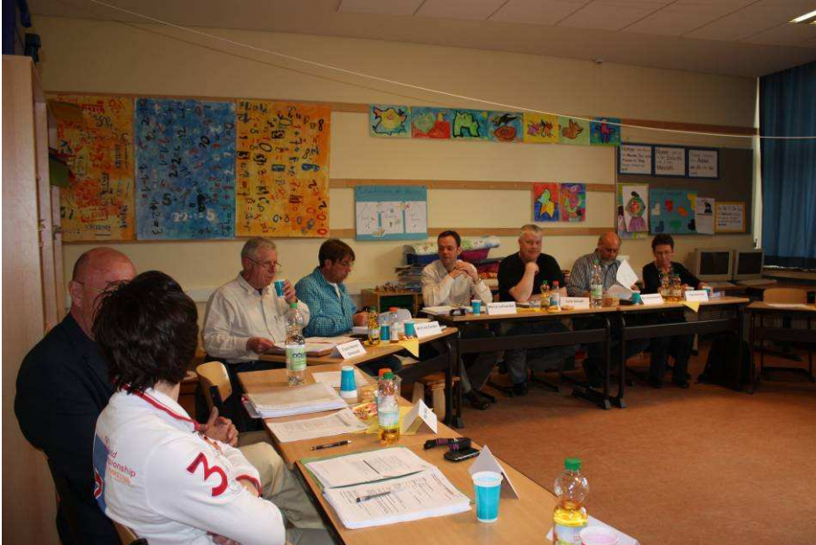
... bei der Arbeit