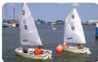
Viele verschiedene Sportarten mit dem Ferienpass.