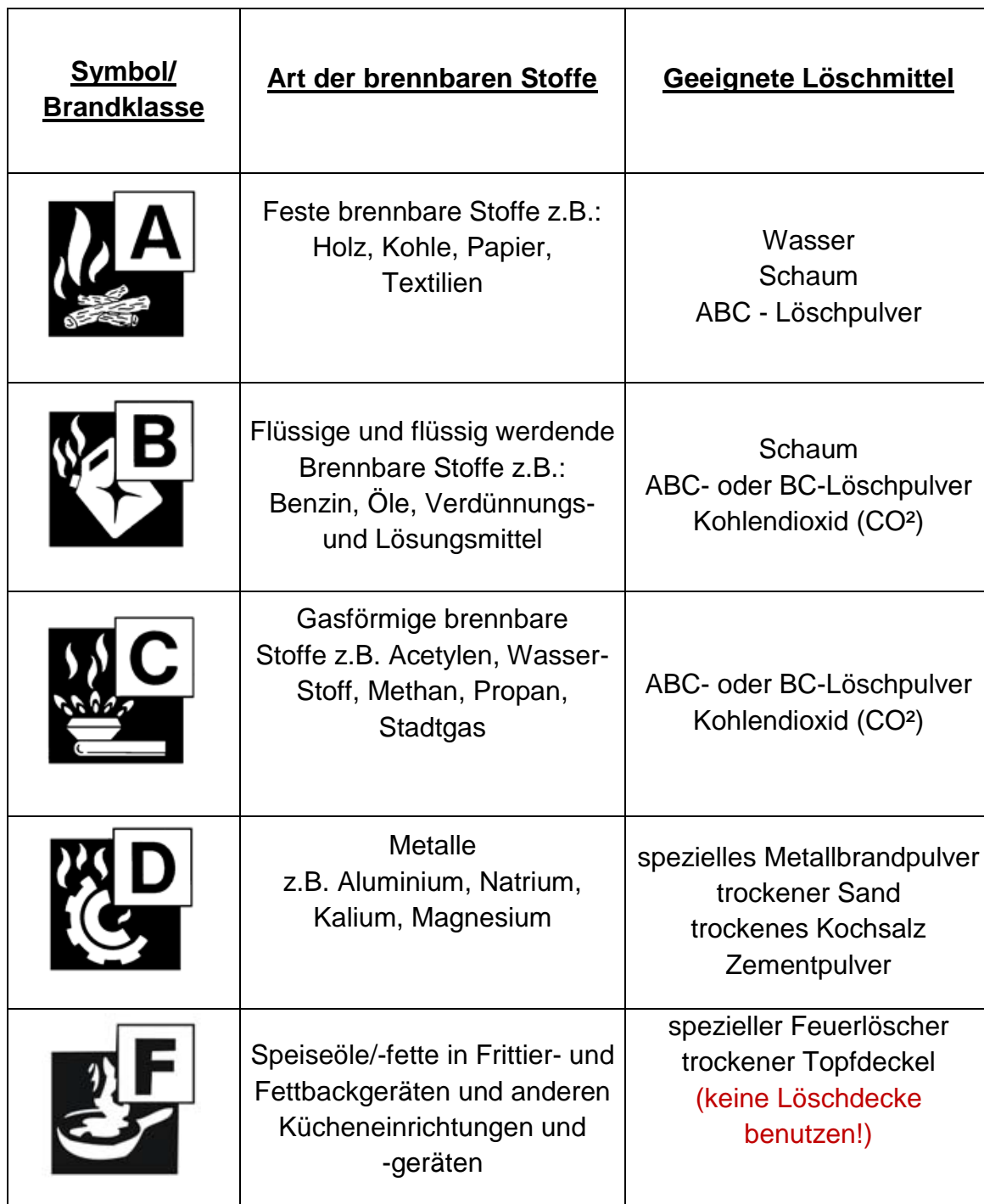
Tabelle 1: Brandklassen und zugeordnete geeignete Löschmittel

Grundsätzlich sind die in ihrem Bereich aufgehängten Feuerlöscher für die dort vorkommenden brennbaren Materialien (Brandklasse) ausgewählt worden. Besonderheiten können der nachfolgenden Tabelle entnommen werden.