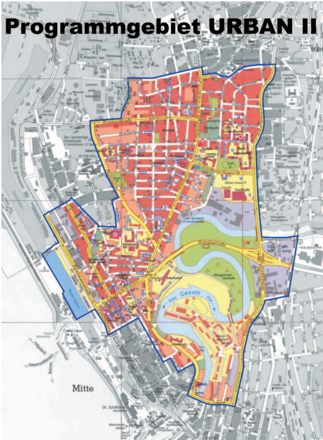
Karte: URBAN II-Programmgebiet Bremerhaven