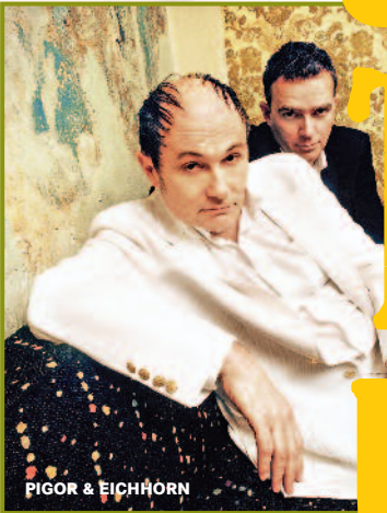
PIGOR & EICHHORN

In diesem Jahr haben wir an 8 Tagen die Crème des deutschsprachigen Kabarett zu uns ins Capitol eingeladen.